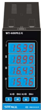
80×160×140 mm 竖式 开孔 76 +0.5 ×152 +0.5 mm