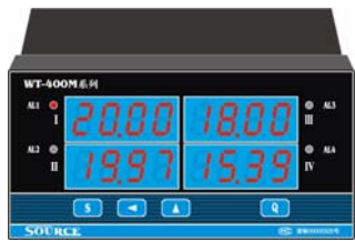
160×80×140 mm 横式 开孔 152 +0.5 ×76 +0.5 mm